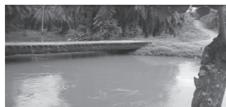
Gráfico N° 2 Puente actual sobre el río Inga

El proyecto "Puente sobre el río Inga", se desarrolla en la provincia de Pichincha, ubicado en la vía Occidental 2- Agrupación Los Ríos, en el Cantón Puerto Quito, Provincia de Pichincha; se caracteriza por tener un terreno con vegetación y suelo natural, no uniforme.