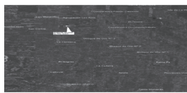
Gráfico N° 1 Ubicación puente -sobre el río Inga